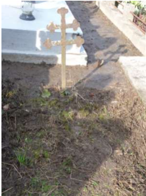
Krzyż bożogrobców odnaleziony na Cmentarzu Parafialnym w Rudolowicach na zapomnianym grobie.

W Rudolowicach tę zaszczytną funkcję pełnią członkowie straży pożarnej. Potocznie nazywani są strażakami. W Pruchniku bożogrobcami, w Przemyślu krzyżakami, a w okolicach Przeworska turkami. Ostatnia z nazw odnosi się do odsieczy wiedeńskiej, podczas powrotu po zwycięskiej bitwie wojska Jana III Sobieskiego w Wielki Piątek wstąpiły do kościoła, aby trzymać honorową straż przy Grobie Pańskim w podziękowaniu za szczęśliwy powrót.