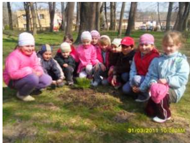
Pierwszaki wokół swojego drzewka.