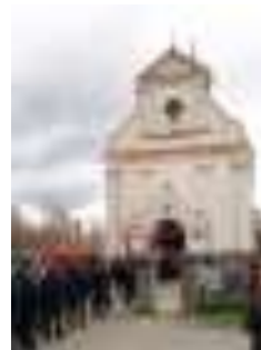
Tłumy mieszkańców przed Kościołem Parafialnym w Rudołowicach