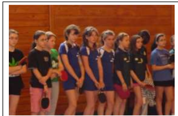
Nasze szóstoklasistki na Rejonowych Zawodach w Tenisie Stołowym w Dubiecku.