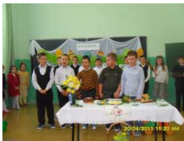
Drugoklasiści w scenie z kogucikiem.